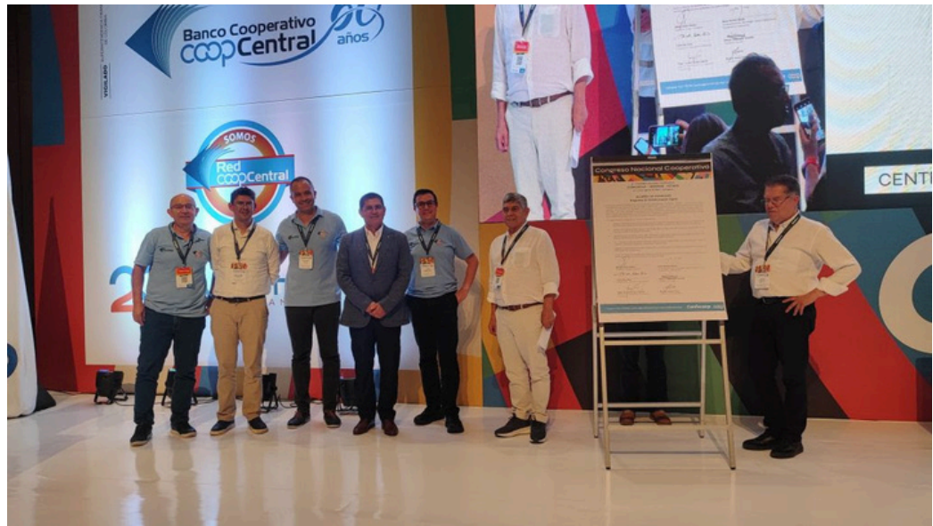
Esquema de Trabajo para un Programa de Transformación Digital desde el Sistema Confecoop