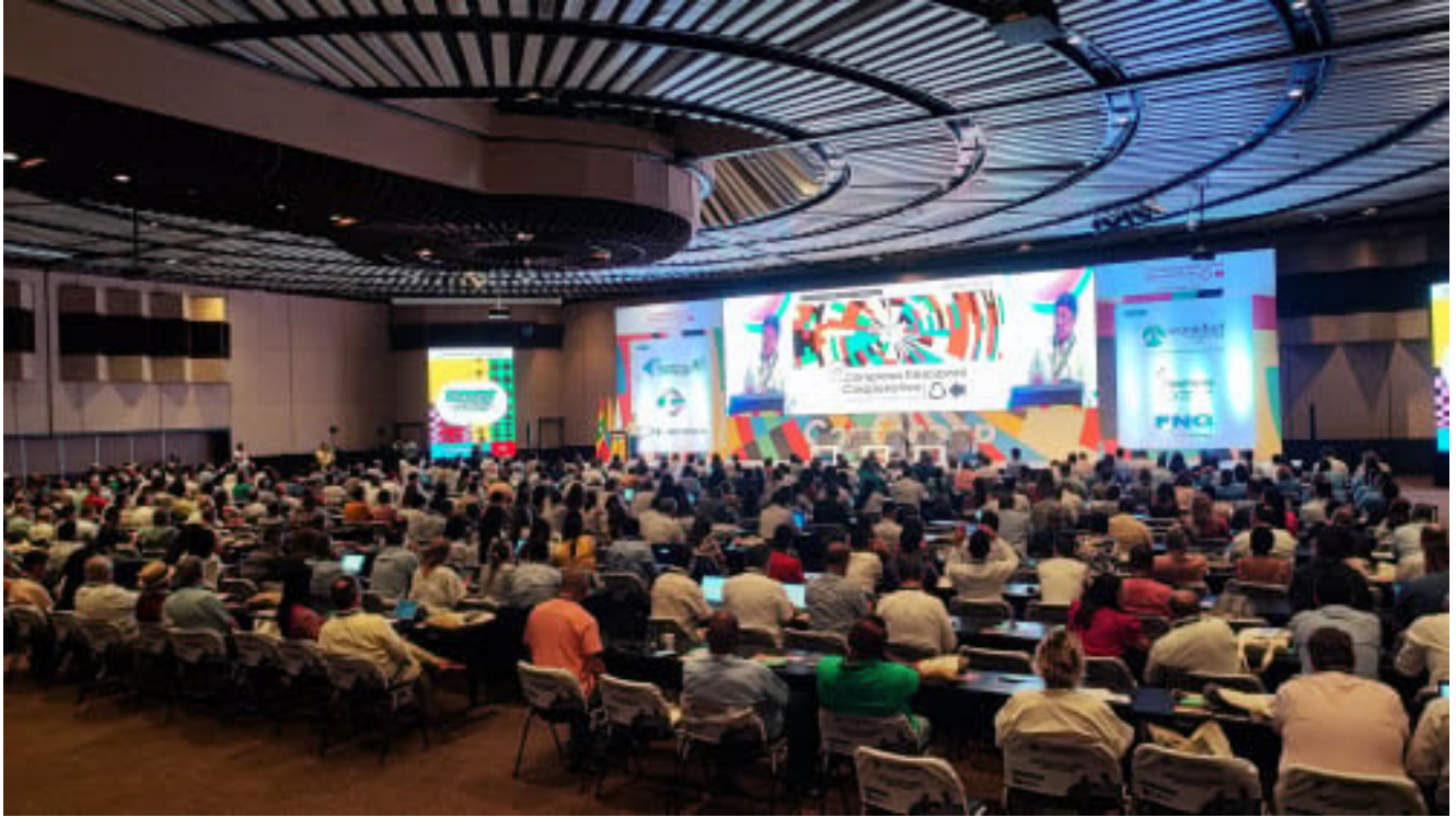
Auditorio Centro de Convenciones de Cartagena 23 Congreso Cooperativo