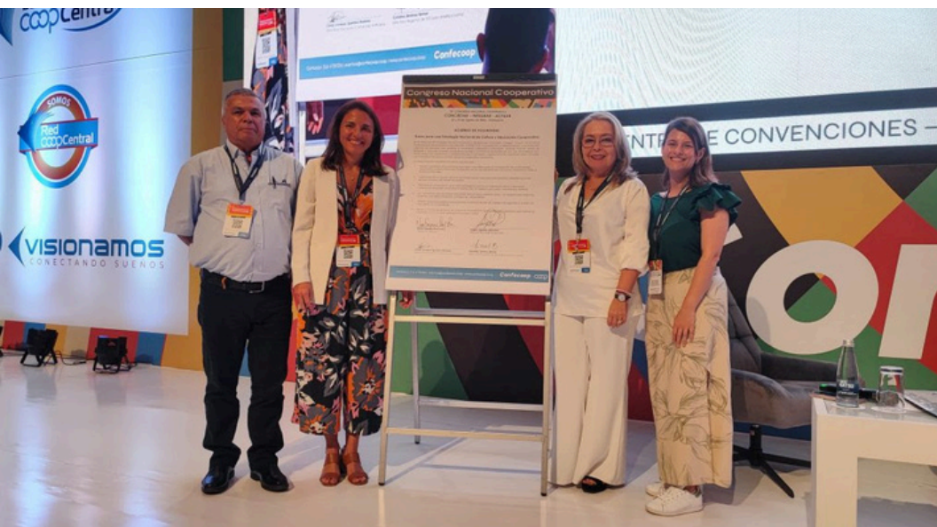
Bases para la consolidación de una estrategia nacional de Cultura y Educación Cooperativa desde el Sistema Confecoop