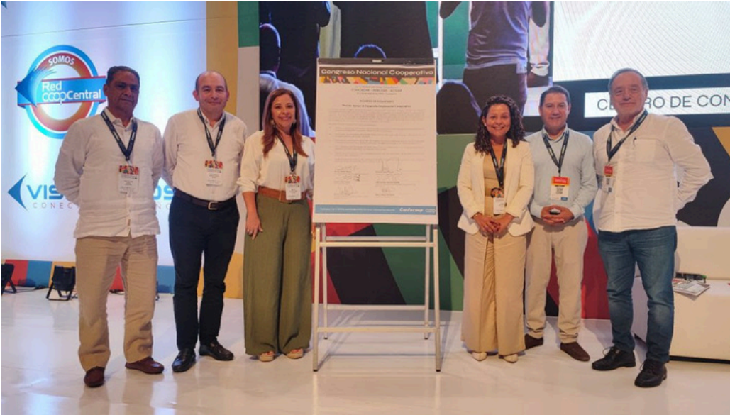
Construcción de una Red de Apoyo desde el Sistema Confecoop para el desarrollo empresarial cooperativo