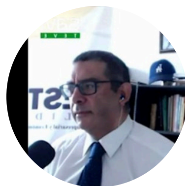
Por: Alfredo Alzate Escolar

Su posibilidad de crecer dentro de diferentes nichos donde la población está más cerca de la empresa cooperativa; sea el barrio, el pueblo o la región, es otro factor el cooperativismo tiene como argumento básico para llegar a intervenir con su oferta comercial, pero, sobre todo, con la integración de sus comunidades en esos procesos autogestionados.