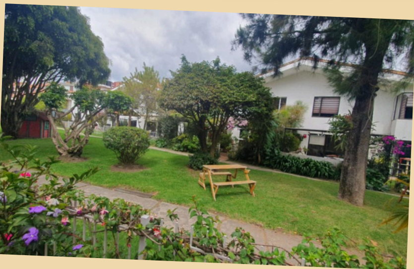
VENDO HERMOSA CASA EN EL BARRIO CONTADOR – Bogotá

Estas y cientos de ofertas en gestionsolidaria.com