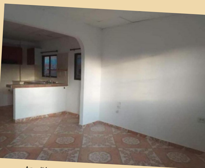
Amplió Apartamento – Ideal Para Inversión En Barranquilla