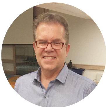
Por: Ricardo Lozano Pardo Consultor empresarial

Mucho se ha dicho y hablado de este modelo financiero, de su origen, de su implementación y de las consecuencias de ponerlo en práctica en el sector financiero cooperativo, pero considero que falta mucha información al respecto para entender la importancia de esta práctica financiera, cuando de manejo de riesgos se trata.