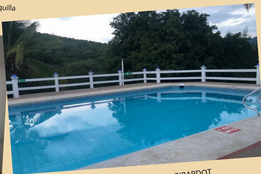
VENTA – HERMOSA CASA EN GIRARDOT