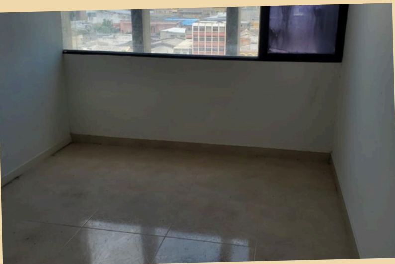
Oficina Para La Venta En El Centro Histórico De Barranquilla

Estas y cientos de ofertas en gestionsolidaria.com