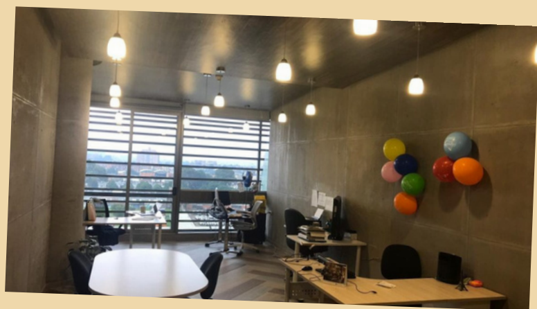
Venta Oficina Centro Empresarial Pontevedra Bogotá