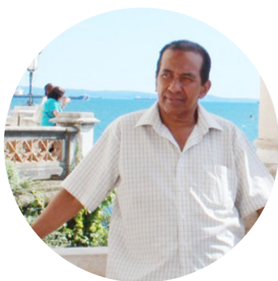
Por: Eliécer Bermúdez Director-Corjireh

El buen gobierno de una empresa solidaria compete en primer lugar al Consejo de Administración, a la Junta de Vigilancia, a la revisoría fiscal, a la auditoría interna si la hubiere, y a la gerencia.