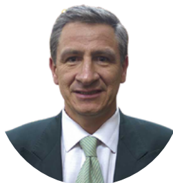
Por: Francisco Sánchez Motta Consultor Cooperativo

Teniendo en cuenta que la integración es resbalosa, aceitosa y por ende difícil; Es importante observar otras opciones para el desarrollo de las cooperativas de ahorro y crédito con eficiente existencia en el mediano y largo plazo.